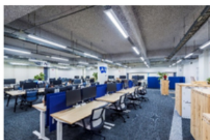
【フォーカスゾーン】