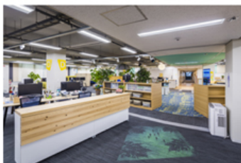
【「WELL v2」ゴールド認証を取得したシステムソリューション開発センター】